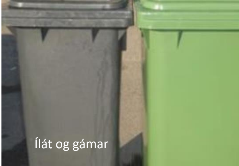
Ílát og gámar