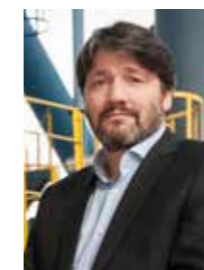
Bolli Árnason Kjörin endurkjörin