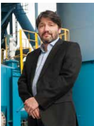
Bolli Árnason GT tækni