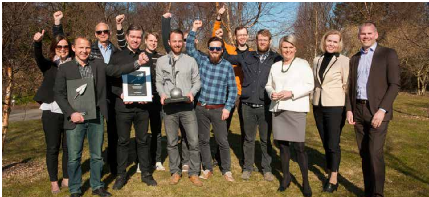
BOXID - Framkvæmdakeppni framhaldsskólanna

Undirbúningur í skólum landsins fer fram samhliða skólaárinu. NKG hefst á haustin og lýkur á vorin með vinnusmiðju þar sem þátttakendur í úrslitum fá tækifæri til að útfæra hugmyndir sínar frekar með aðstoð leiðbeinenda frá Háskóla Íslands og Háskólanum í Reykjavík. Samtök iðnaðarins eru meðal bakhjarla keppninnar.