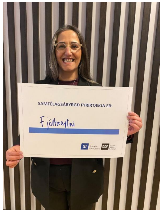
Mynd 2: Fida á aðalfundi SSP árið 2021

*Íris Ólafsdóttir sagði sig úr stjórn í febrúar 2022