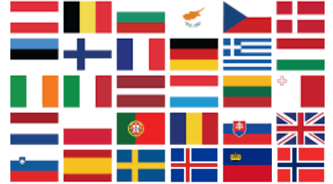
Notkun byggingarvara - Landslög