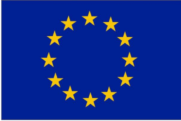
Markaðssetning byggingarvara - EES reglugerðir