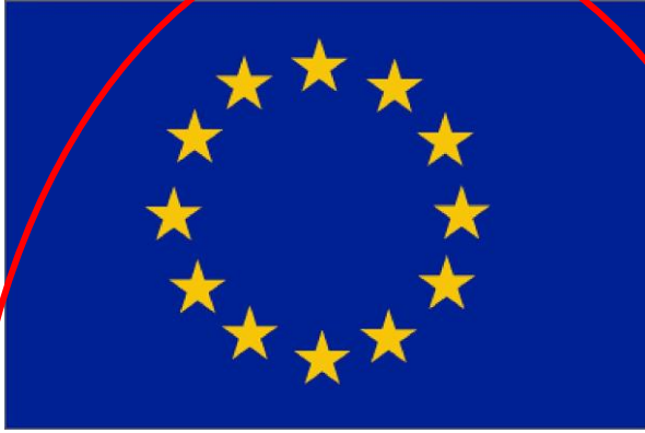
Markaðssetning byggingarvara - EES reglugerðir