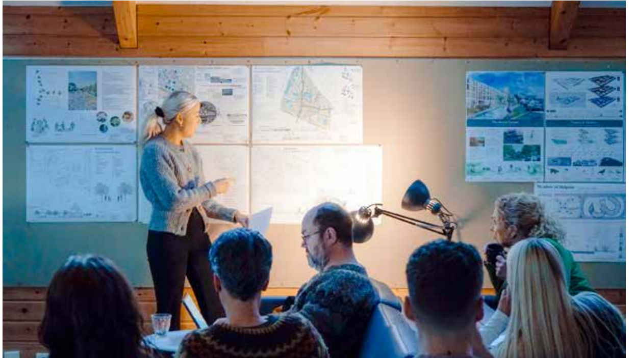
Nemendur í landslagsarkitektúr kynna verkefni um hönnun Skeifunnar fyrir samnemendum og kennurum.

tektúr, skipulagsfræðum eða öðrum skyldum greinum. Þeir nemendur sem fara í meistaranám í landslagsarkitektúr eiga möguleika að því framhaldsnámi loknu að fá réttindi sem landslagsarkitektar, sem er lögverndað starfsheiti á Íslandi.“