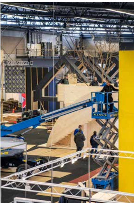
Undirbúningur er í fullum gangi fyrir stórsýninguna Verk og vit sem haldin verður í Íþrótt- og sýningarhöllinni í Laugardal.