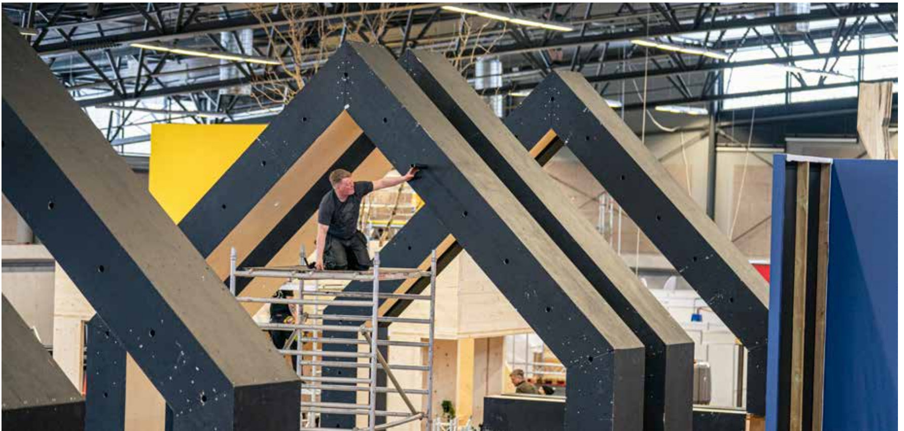
Verið er að setja upp sýningarrými BYKO á Verk og vit.