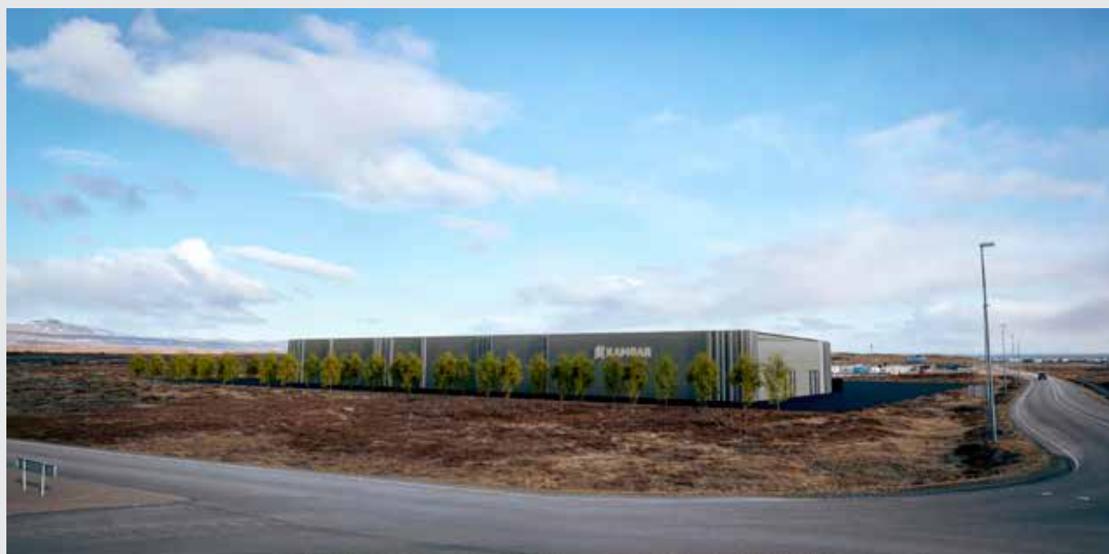
Tölvuteikning af nýrri verksmiðju Kambar sem verður að reisa í Þorlákshöfn. Áætlað er að verksmiðjan hefji starfsemi í sumar.

„Glugginn er hannaður á Íslandi og verksmiðjuframléiddur fyrir íslenskar aðstæður. Hann er afhentur glerjaður og