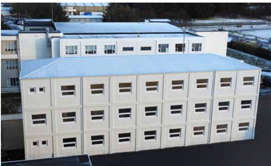
Skrifstofuhúsnæði við Landspítalinn á Hringbraut er einingahús.