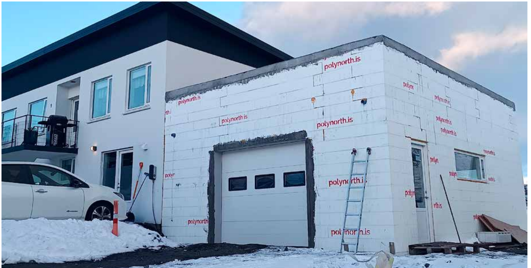
Bílskúr í Glerárhverfi á Akureyri.