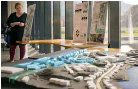
Nemendur í skipulagsfræði kynna hér afrakstur verkefna sinna Uppbygging án vaxtar í kúrsinum Hagnýtt og heildstætt skipulag þar sem viðfangsefnið var ný fram tíðarsýn fyrir Borgarnes.