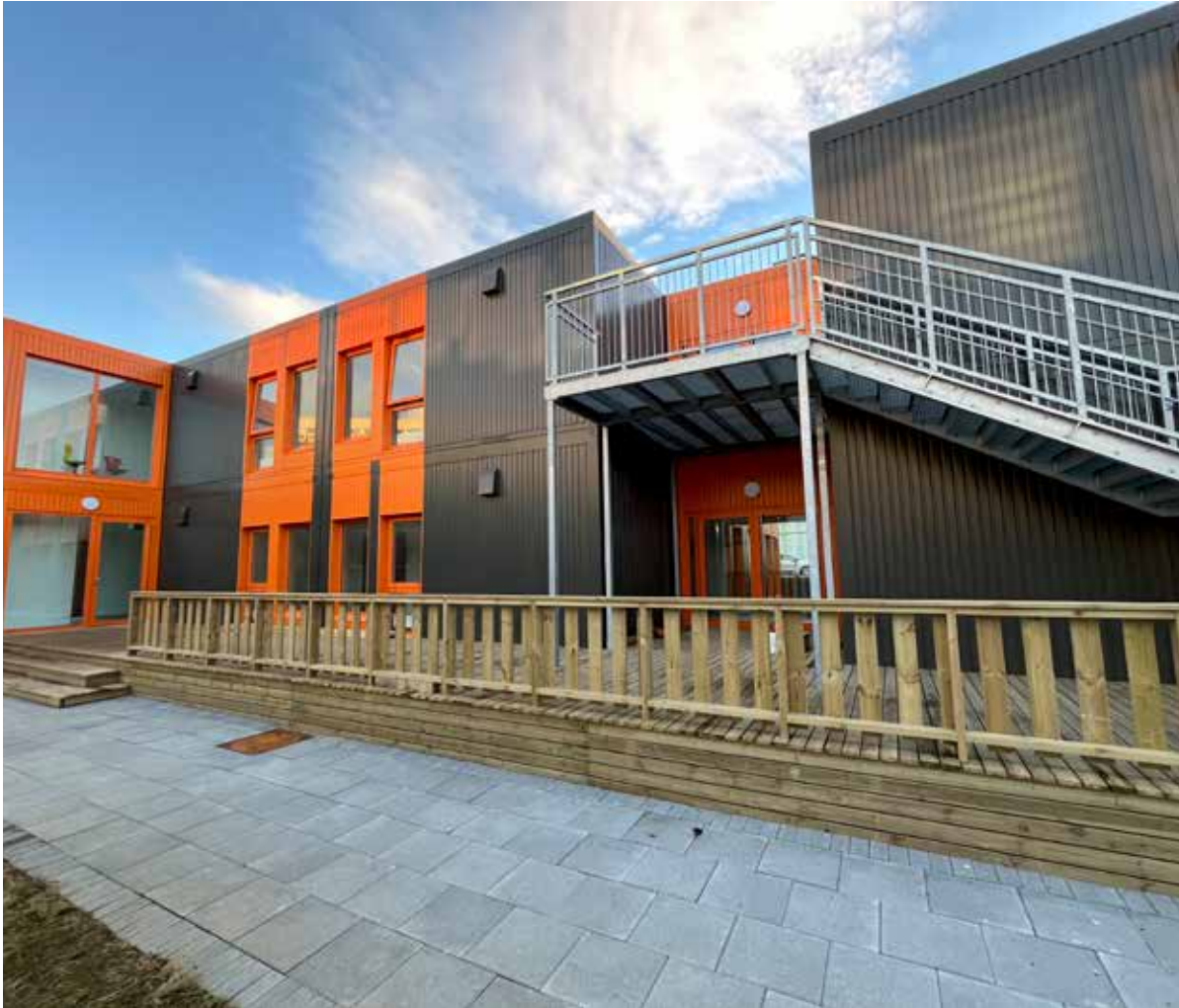
Hagaskóli í Reykjavík er einingahús og eitt af stóru verkefnum hjá Terra Einingum.