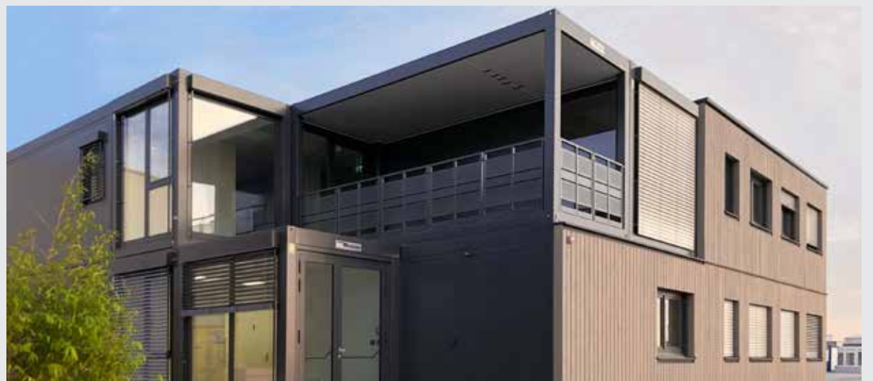
Stólpi Gámar býður nú gæða skrifstofu- og gistieiningar í nýrri húseiningalínu línu frá Containex í Austurríki.

skömmu frá kaupum á fyrirtækinu Alkul ehf. Við kaupin hefur Stólpi Gámar eft starfsemi sína og getur fyrirtækið nú boðið áralanga sérhæfða þekkingu á öllu er viðkemur frystikerfum, með alhliða viðgerðum á kæli- og frystitækjum ásamt leka- og bilanagreiningu, sem og áfyllingu allra gerða A/C kerfa.