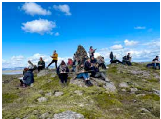
Hópur nemenda í landslagsarkitektúr er hér í kúrsinum að skynja og skissa umhverfið.