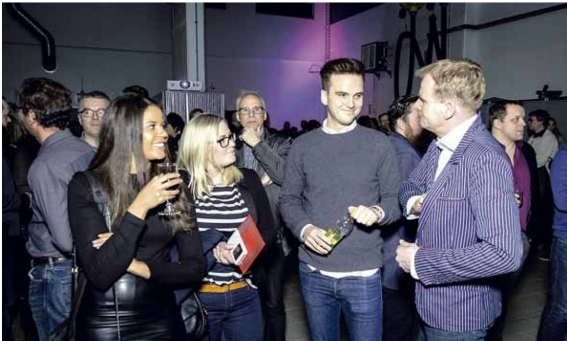
Þróun Sjónum var beint að prentun og þróun umbúða, hröðum tækninýjungum innan prentiðnaðarins, hönnun og handverki.