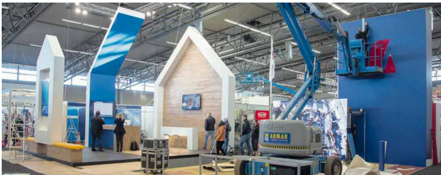
Fjölbreytni 16 fyrirtæki sem tilheyra Samtökum iðnaðarins voru þátttakendur á sýningunni Verki og viti sem um 23 þúsund gestir sóttu.

Fyrirtækin innan SI sem kynntu vörur sínar og þjónustu á sýningunni í Laugardalshöll eru BM Vallá, EFLA, Gámaþjónustan, Hampiðjan, Ístak, Kaffitár, LNS Saga, Malbikunarstöðin Hlaðbær Colas, Mannvit, MT Högjard Iceland, Steinull, Steypustöðin, Spælast Iceland, Verkfræðistofan Hannarr, Verkfræðistofan Vista og Verkís.