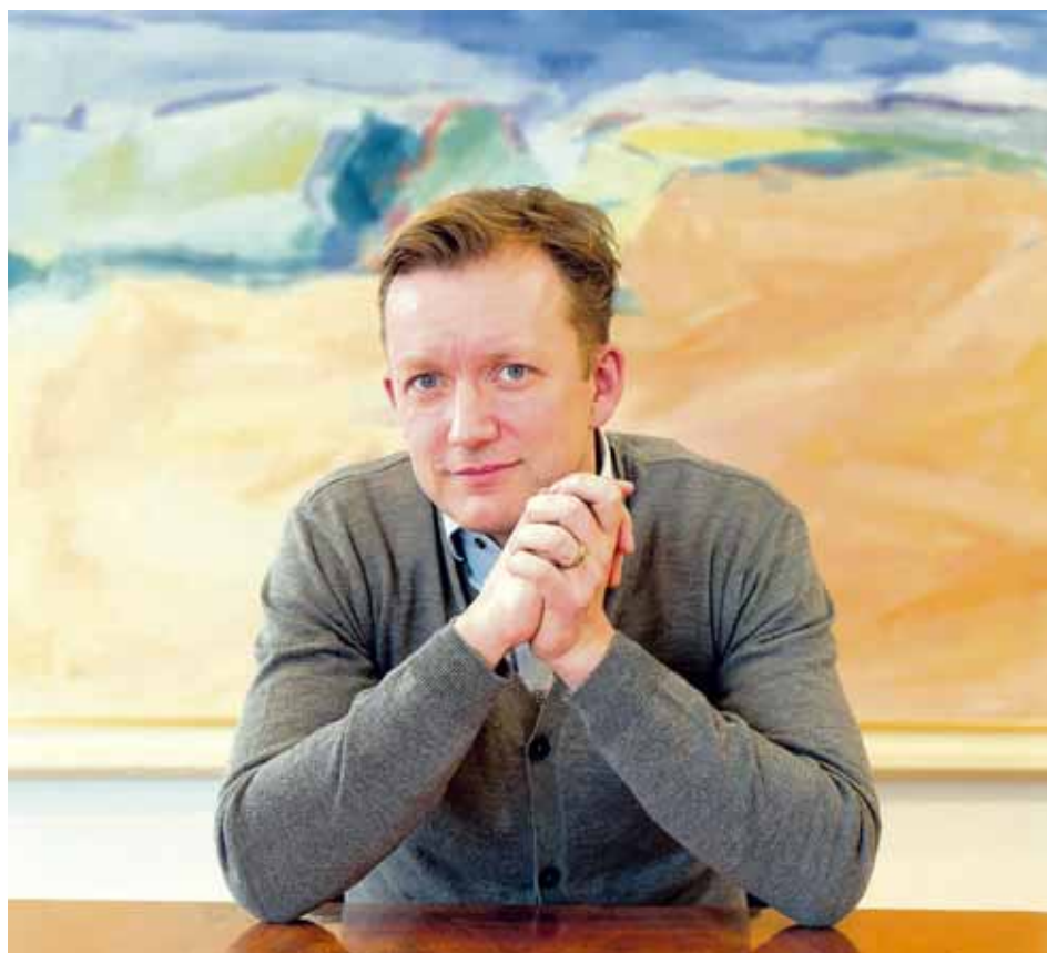
Framboð Aukið framboð á ódýru áli frá Kína hefur haft áhrif á eftirspurn á mörkuðum?

„Það er rétt að það eru áskoranir í álframléiðslu á heimsvísu,“ segir Pétur. „Par munar mest um að hægst hefur á vexti eftirspurnar í Kína, en á sama tíma hefur ekki dregið úr aukningu framboðs í þessu miðstýrða hagkerfi. Kína framléiðir yfir helm-