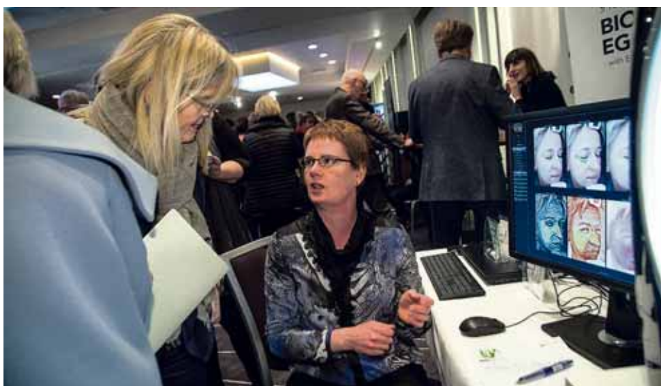
Húdtækni Orf líftækni var með tæki á staðnum sem gerir mælingar á húð og les í raka og öldrun húðar.