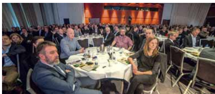
Fullt hús Fundargestir, sem voru fjölmargir, hlýða á ræðu ráðherra.

Menntun var til umræðu á þinginu og kallað var eftir því að menntakerfið geri meira til að sýna ungum nemendum fram á möguleikana sem