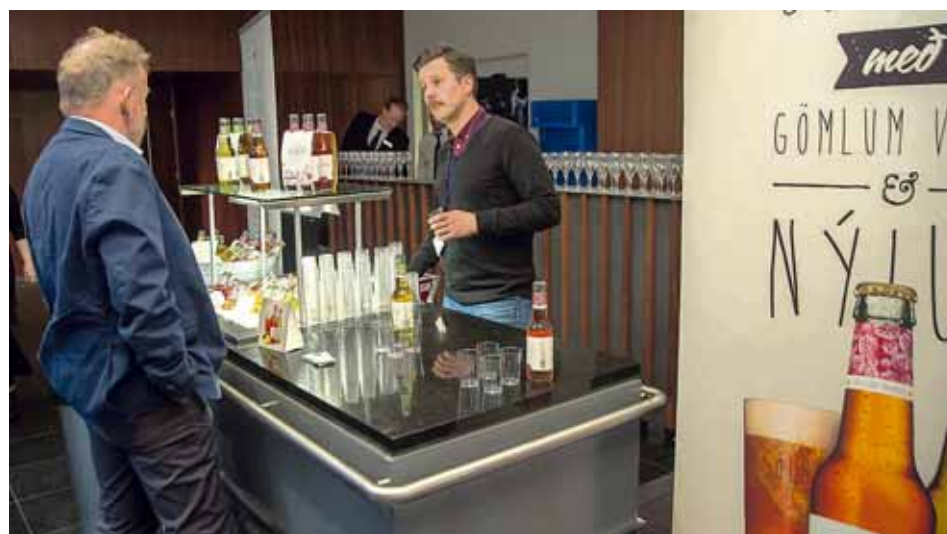
Sólbært Ölgerðin kynnti sumarlegan drykk sem fyrirtækið er að setja á markað undir merkinu Sólbært.