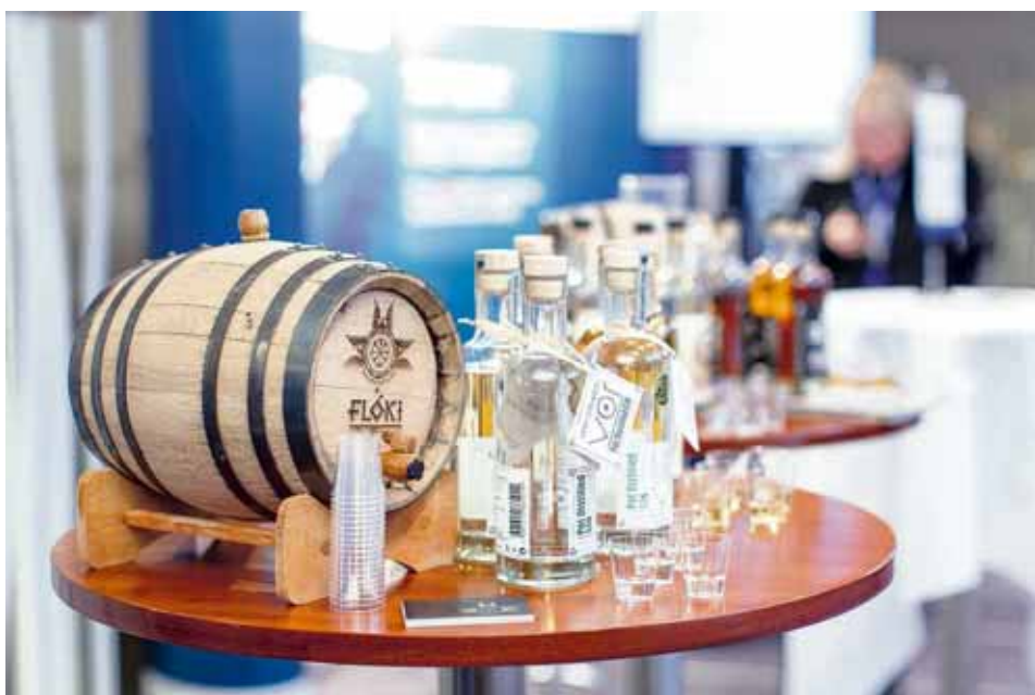
Brugg Bruggverksmiðjan Eimverk bauð gestum að kynna sér og smakka á Flóka-viskíi.