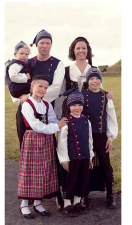
Þjóðleg Fjölskylda Eyrúnar kann vel að meta þjóðbúningana sem hún saumar í frístundum.

samfélagið verður seint metin til fulls. En fyrirtækin eru fleiri, Valka er t.a.m. annað öflugt fyrirtæki sem framleiðir vélar fyrir sjávarútvegsfyrirtæki, bátasmiðjan Rafnar spratt upp úr velgengni Össurar og dæmin eru fleiri. Slík fyrirtæki þurfa fleira starfsfólk ef