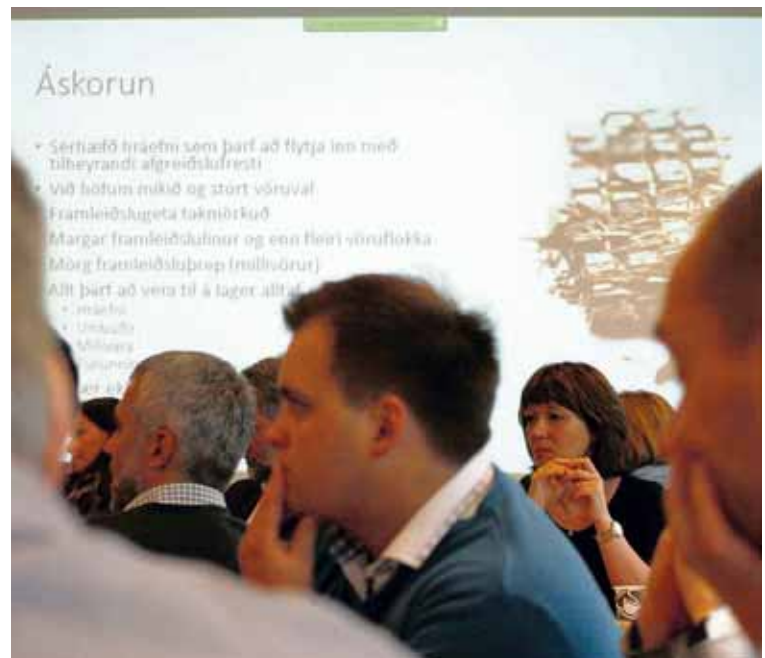
Framleiðni SI hefur sett upp fundaröð þar sem sérfræðingar deila reynslu sinni.

Markmið SI er að auka framleiðni en aukin framleiðni er forsenda betri afkomu fyrirtækja og bættra lífskjara almennings. Framleiðni á hverja unna vinnustund á Íslandi er undir meðaltali OECD-ríkjanna en vegið er upp á móti því með mikilli vinnu. Árlegur raunvöxtur framleiðni hefur verið 1,3% undanfarið en markmiðið er að ná framleiðnivexti upp fyrir 2% á ári. SI hefur í því augnamiði sett upp fundaröð þar sem fyrirtæki deila reynslu sinni af því að auka framleiðni í alls konar framleiðslu sama í hvaða geira þau eru. Fyrirtæki sem virðast ólík í fyrstu eiga margt sameiginlegt en þegar kemur að skipulagi, ferlum og stýringu geta þau lært hvert af öðru. Hjá fyrirtækjum innan SI er mikil reynsla og þekking og með fundahöldunum gefst tækifæri fyrir sérfræðinga og stjórnendur að deila sinni reynslu og læra þannig hvert af öðru. Fundirnir hafa verið vel sóttir en á hvern fund koma þrjú fyrirtæki sem segja frá því hvernig þeim hefur tekist að auka framleiðni í sínum rekstri.