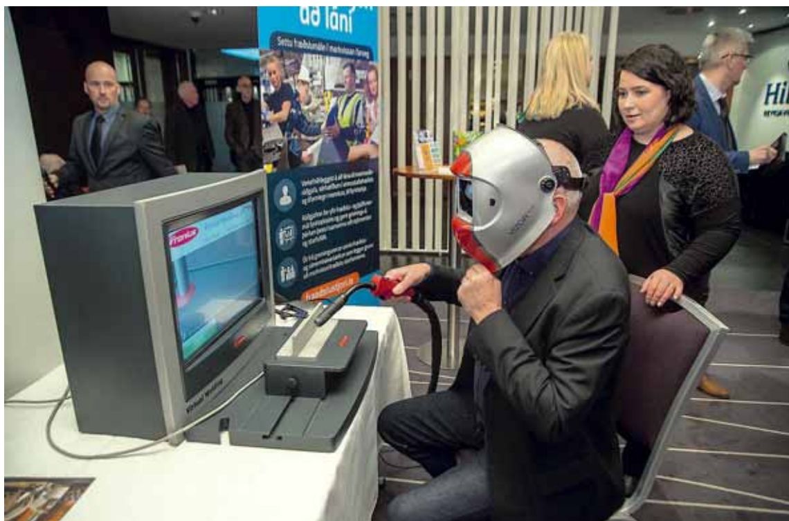
Allt á suðupunkti IDAN var með nýjan suðuhermi á staðnum sem gestir gátu fengið að prufa.

Gestir fengu tækifæri til að kynna sér nýjungar í framleiðslu og starfsemi íslensks iðnaðar á Hilton Nordica þar sem þingið fór fram. Þar var af ýmsu að taka enda mikil breidd í íslenskum iðnaði.