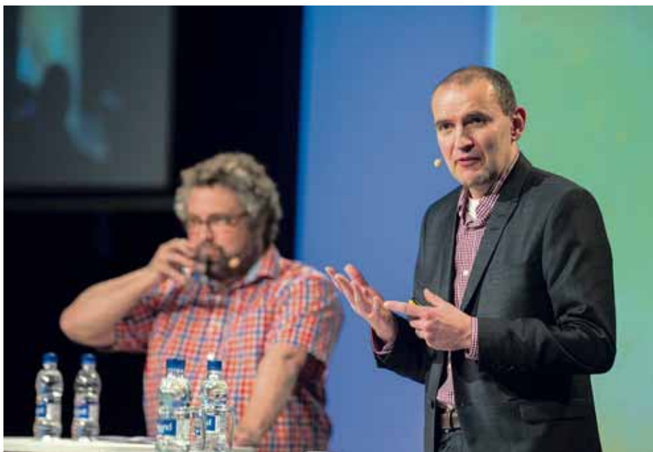
Sögulegt grín Guðni Th. Jóhannesson sagnfræðingur og Stefán Pálsson, rithöfundur og spurningahöfundur, héldu erindi um framfarir í sögulegu ljósi sem salurinn kunni vel að meta.