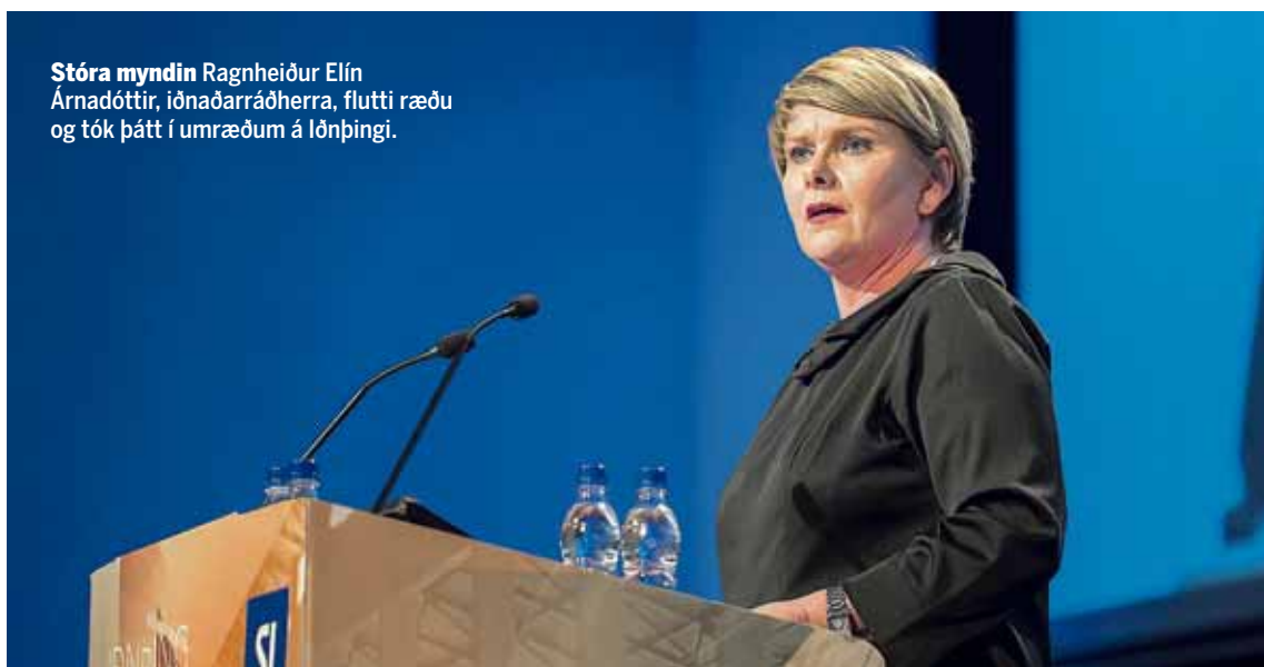
Stóra myndin Ragnheiður Elín Árnadóttir, iðnaðarráðherra, flutti ræðu og tók þátt í umræðum á Iðningi.

Það kom fram í máli margra sem ræddu málin á þinginu að það er hávær krafa um að bæta starfsumhverfi tæknifyrirtækja sem starfa á alþjóðamarkaði hér á landi. Þú sagðir sjálf að það sem þyrfti að gera til að bæta starfsumhverfi fyrirtækja yrði gert. Hvað er verið að gera?