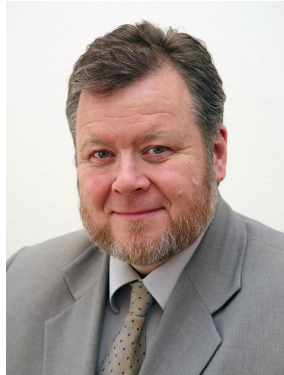
Össur Skarphéðinsson, iðnaðarráðherra