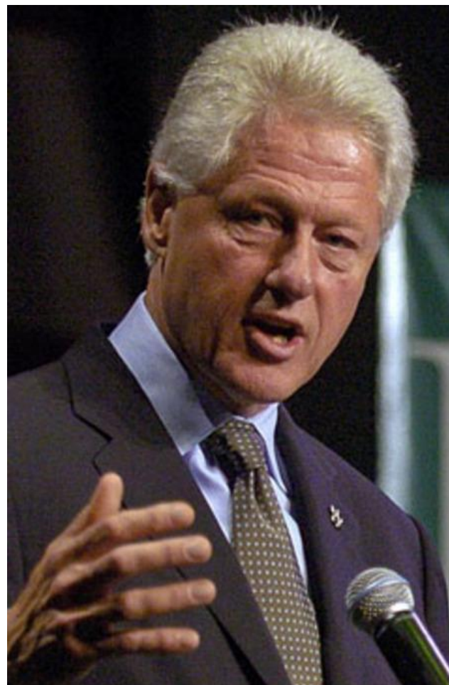
Bill Clinton, fyrrverandi forseti Bandaríkjanna

... fyrir um áratug ákvað Clintonstjórnin að slaka á kröfum um tryggingar og veð fyrir lánum