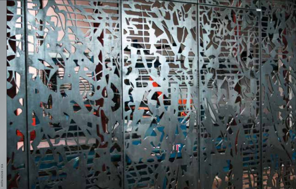
HVÍTA HÚSÍÐ / SÍA

Íslensk málm- og véltækniyrirtæki stefna áfram að því að bjóða viðskiptavinum afbragðs viðgerðar- og viðhaldsþjónustu á grundvelli gæðastýringar og fyrirbyggjandi viðhalds.