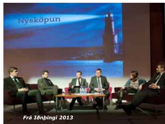
Frá Iðnþingi 2013

Áformum um fyrirhugaða Iðnsýningu 6. – 9. mars hefur verið hætt vegna ónógrar þátttöku sýnenda. Goggur útgáfufélag hefur undanfarna mánuði unnið að framkvæmd sýningarinnar og áttu SI fulltrúa í verkefnastjórn auk þess að vera aðalstyrktaraðili hennar. Í stað sýningar verður afl beggja aðila sett í aðra viðburði á afmælisári.