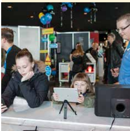
Hvað ungur nemur gamall temur