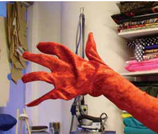
Tilraunir með nornahanskagerð

Það hét áður Félag meistara og sveina í fataið en heitir nú Klæðskera og kjóla-meistarafélagið. Við létum hana fyrir okkur nýtt lógó eða kennimerki sem við erum mjög ánægðar með. Ég segi ánægðar því að eins og er eru aðeins konur í félaginu sem er miður og hér og nú óskum við eftir að karlmenn með þessa menntun gangi til liðs við okkur. Í félaginu eru tæplega 90 konur og flestar menntaðar sem sveinar í klæðskurði eða kjólasaumi í Iðnskólanum í Reykjavík en stór hluti félagsmanna er einnig með meistararéttindi.