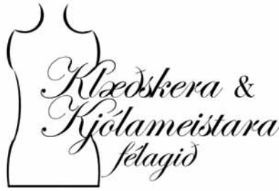
Nýtt kennimerki félagsins

Eftir á að hyggja tel ég að það hefði verið nær ómögulegt að útfæra þetta á þennan hátt og með fagmanneskju í sníðagerð og saumum. Ég hef líka góða reynslu í búningagerð þar sem ég hef unnið þó nokkuð við búningagerð bæði sjálfstætt og í leikhúsum. Reynslan er alltaf mikilvæg.