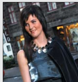
Sýnishorn af framlagi þátttakenda í nokkrum keppnisgreinum á Ísmóti 2007.

Meðal viðburða á ÍSMÓTI 2007 - Íslandsmeistaramóti SI og þjónustuiðngreina helgina 1. og 2. sept.: