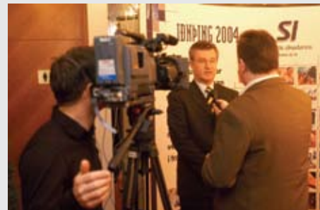
10 ára afmæli SI, á Iðnþing 2004