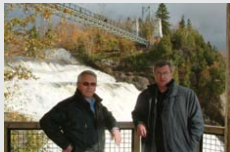
Kynniserð til Alcoa í Kanada