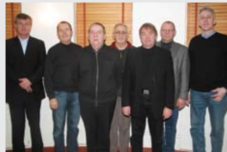
Menntafélög iðnaðarins sameinuð

Um 1990 stóð til að gera uppstokkun á fjárfestingarlánasjóðum atvinnuveganna, þar með talið Iðnlánasjóði og Iðnþróunarsjóði. Urðu um þetta allmikil átök við ríkisvaldið og var deilt um eignarhald. Um skeið var áformað að stofna Íslenska fjárfestingarbankann hf. og tilkynnti þáverandi iðnaðarráðherra að bankinn yrði í jafnri eigu samtaka í iðnaði og ríkisins í 60 ára afmæli FÍÍ árið 1993. Svo fór þó ekki og niðurstaðan varð sú að taka Fiskveiðisjóð inn í dæmið ásamt Iðnþró-