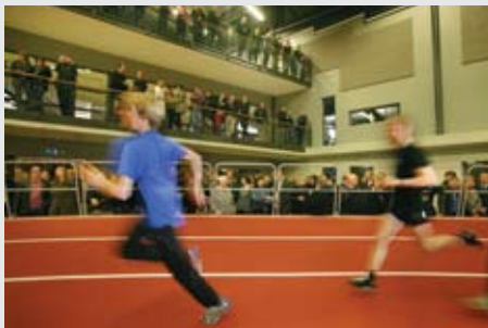
Ný Laugardalshöll vígð

„Í mínum huga er stækkun álversins í Straumsvík ákveðinn vendipunktur í íslensku efnahagslífi á síðari tímum. Stækkunin var tekin formlega í notkun í október 1997 en ákveðin með samningum haustið 1995. Þá tóku hjólin að snúast og má nánast segja að stanslaus uppgangur hafi verið allar götur síðan. Það er raunar fróðlegt að minnst þessa í ljósi þess