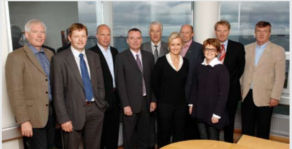
Núverandi framkvæmdastjóri SI, stjórn SI og fráfarandi framkvæmdastjóri

vinnulíf okkar er, sem betur, fer orðið fjölbreytt og alþjóðlegt. Þess vegna er nauðsynlegt að búa því starfsskilyrði sem halda vexti þess í landinu í stað þess að við högum okkar málum eins og við gerum nú og verður til þess að við glutum niður þeim mikla árangri sem við höfum náð. Ég má ekki til þess hugsa að útrásin breytist í flóttu."