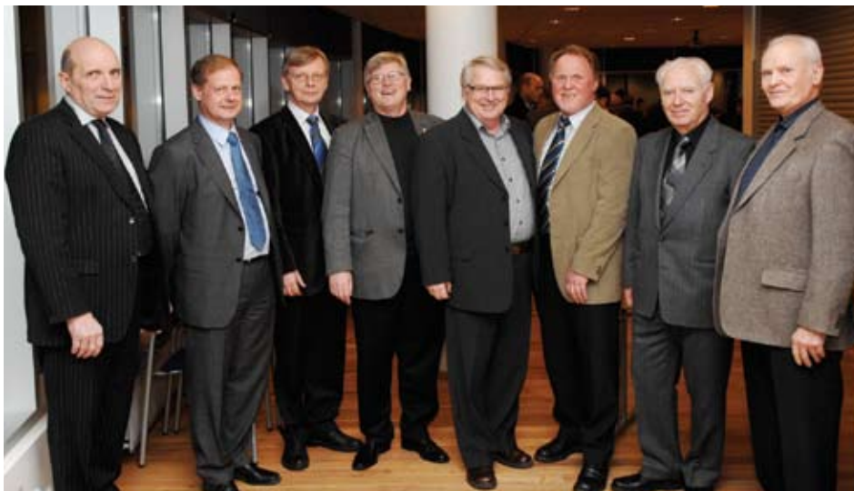
7 af fyrrverandi formönnum Málms, núverandi formaður og forstöðumaður Málms

Gefið hefur verið út myndarlegt áttatíu síðna afmælisrit þar sem greint er frá sögu málm- og véltækniðnaðar á Íslandi ásamt helstu atriðum úr 70 ára sögu félagsins. Ennfremur er sagt frá þeim viðfangsefnum sem félagið vinnur að um þessar mundir í góðu samstarfi við Sam- tök iðnaðarins, IÐUNA – fræðslusetur og aðra sem láta sig varða ýmislegt, sem snertir hag og heill íslensks málm- og véltækniðnaðar. Þau verkefni taka mið af þeirri stefnu sem félagið mótaði árið 2004 og unnið hefur verið eftir síðan. Þar