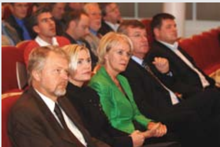
Vel heppnuð ráðstefna - Frá kynningu til markaðar

gott ráð að draga efnahagslífið og rekstur fyrirtækjanna sundur og saman eins og harmonikkunni. Hægari vöxtur og stöðugleiki er miklu betri, að minnsta kosti fyrir iðnaðinn. Reynslan sýnir að sveiflurnar eru íslenskum iðnaði skeinuhættastar. Þær eru okkar efnahagslegi Akkílesarhæll."