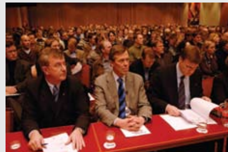
Frá ráðstefnunni Framtíðin er í okkar höndum

Saga og starf Samtaka iðnaðarins er að mörgu leyti samofið samningnum um Evrópska efnahagsvæðið. Það er skemmtileg staðreynd að EES-samning-