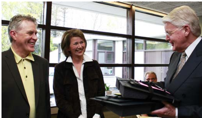
Ólafur Ragnar Grímsson forseti tekur við eintaki úr nýrri vörulínu Múlalundar

Múlalundur, vinnustofa SÍBS var 50 ára á dögunum og var með opið hús af því tilefni 28. maí. Um 200 gestir lögðu leið sína á vinnustofuna, samglöddust með starfslíðinu og þáðu dýrindis veitingar.