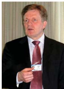
Esko Aho, fyrrverandi forsætisráðherra Finnlands, nú einn af stjórnendum Nokia

sem er rannsóknarstofnun um finnsk efnahagsmál.