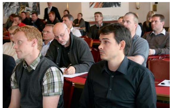
Fjölmenni var á félagsfundinum á Grand hóteli

Með því að lækka geymsluhastig kjötvara úr 4°C í 1°C má lengja geymsluþol um 30% og með því að geyma kjötið niður undir frostmarki þess, við -1,5°C, má lengja geymsluþolið um allt að 60%. Hægt er að nota sjálfvirkar, rafrænar aðferðir til að fylgjast með birgðahaldi í verslun og hjá framleiðendum og til að spá fyrir um innkaup og framleiðslu. Með