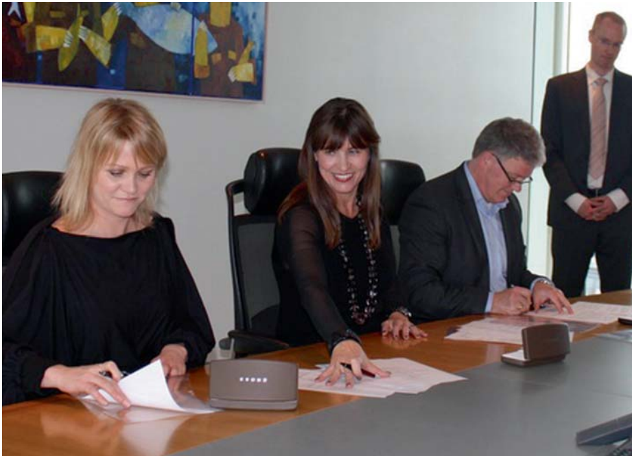
Samningurinn undirritaður 13. október