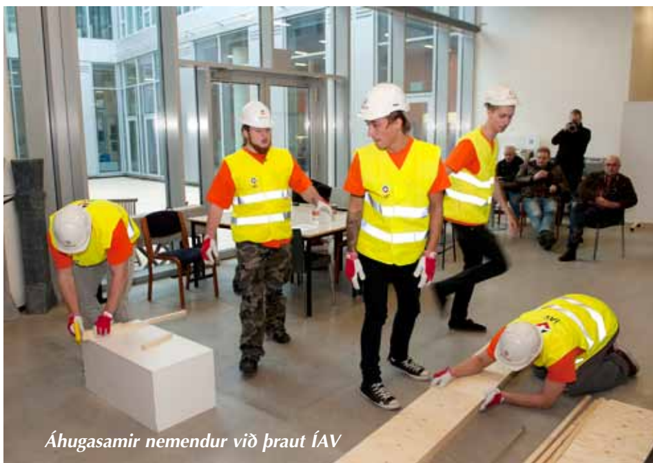
Áhugasamir nemendur við þraut ÍAV