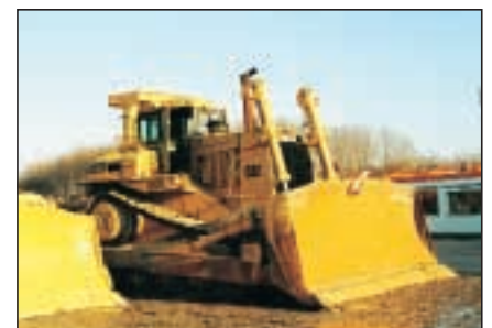
Þessi tíu D10 árg. 88 fóru á 150.000 $ en vinstra megin sést aðeins í D9N árg. 94 sem fóru á 240.000 $