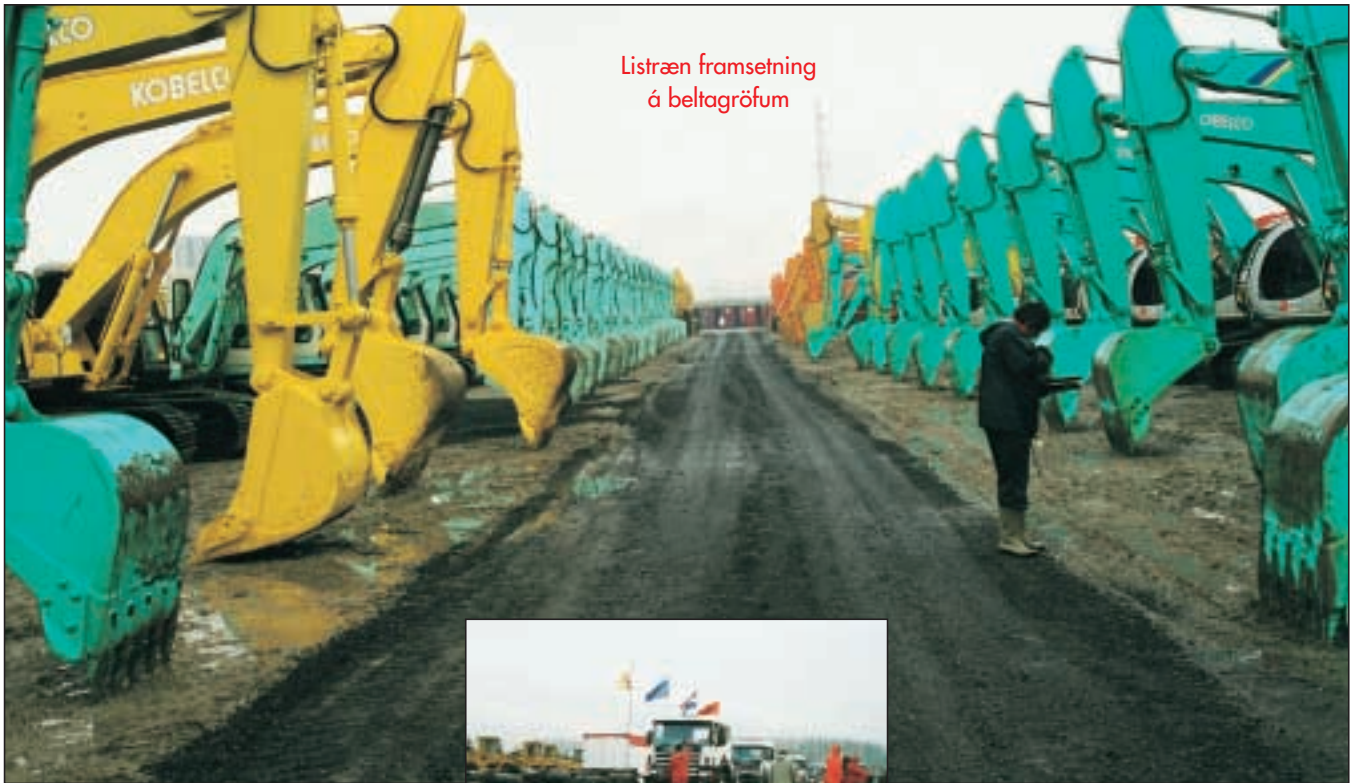
Listræn framsetning á beltagröfum

eigendur á innan við mínútu. – Þess vegna er brýnt að kaupendur viti fyrirfram hvað þeir vilja borga fyrir hvert tæki og í hvaða ástandi það er. En óhjákvæmilega er freistandi að gera tilboð í eitthvert tæki þegar einsýnt er að það er í þann veginn að seljast fyrir smáaura eins og til dæmis 900 þúsund krónur fyrir ónotaðan Unimog, eins og undirritaður fékk að kynna þó að hann sæti á aftasta bekk með blað og blýant en hefði ekki bankaábyrgð fyrir reiðhjóli og enn síður not fyrir Unimoginn þótt hann væri ónotaður. En svona er uppboð! Menn smitast af hinu sérstaka umhverfi og hraðri atburðarás svo það er eins gott að hafa sitt á þurru.