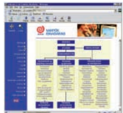
Starfsemi Samtaka iðnaðarins.