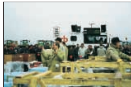
Ýmsir lausamunir voru boðnir upp

Það, sem lýst er hér í mörgum orðum, gerist í raun á örskammri stundu. Tíu bobkettir og sex steypubílar skipta um