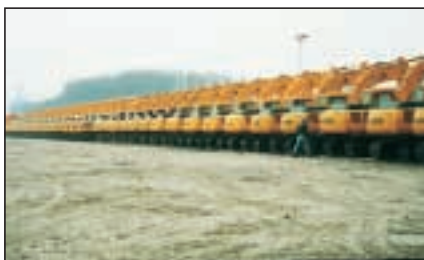
Ónotaðir Hyundai 450 LC series 3 seldust á 140.000 $ og 210 LC series 3 fóru á 63.000 $

Eigendur tækjanna eru í flestum tilvikum verktakar. Langflest tæki eru merkt verktökum frá meginlandi Evrópu. Einnig eru seld tæki frá Asíu eða Mið-