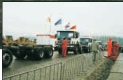
Ónotaðir Scania 114g/340 fóru frá 41.000 $ upp í 47.500 $

færi stórra fyrirtækja, síðan geta smærri hlutir fylgt með. Meðal nokkurra verkataka og vélaumboða er áhugi á að láta reyna á sölu og því verða líklega einhver íslensk tæki seld á næsta uppboði.