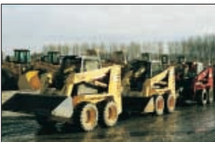
Þessar seldust á 13.500 $ stykkið

Tiltekinn fastur kostnaður eða umstang er fólgið í allri sölu óháð því hversu mikið er selt. Sá, sem á eitt eða tvö tæki á Íslandi, þarf ekki að hugleiða sölu. Annaðhvort þurfa menn að sameinast um ákvörðun um sölu eða það er einungis á