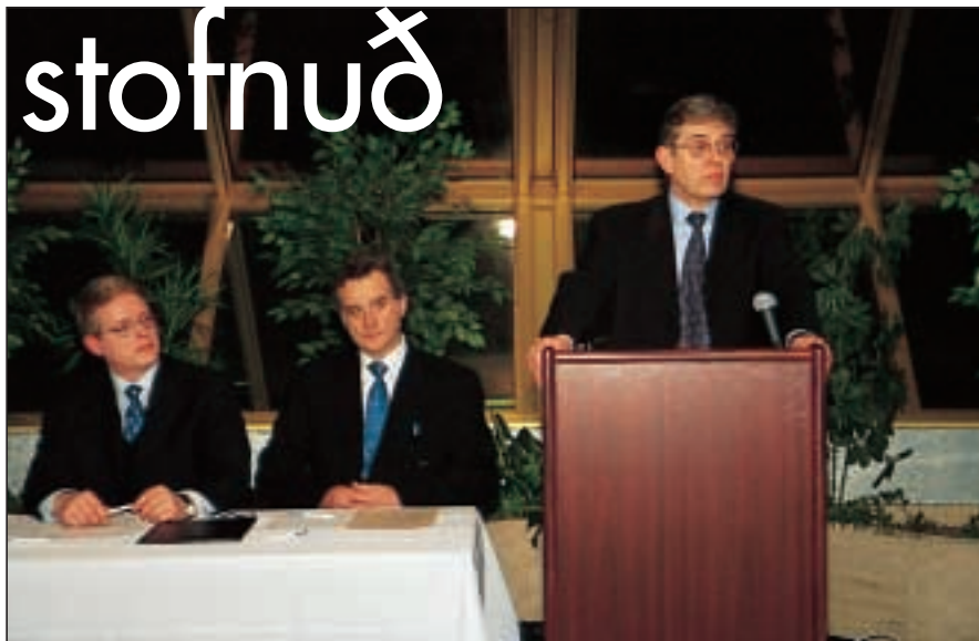
Björn Bjarnason menntamálaráðherra í ræðustól