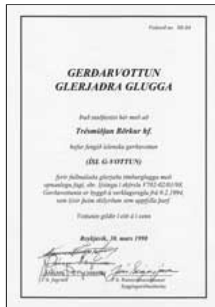
Sýnishorn af vottorði

Nú, þegar níu ár eru liðin frá þessum breytingum á byggingarreglugerðinni, hefur ekki ennþá verið látið reyna á þetta ákvæði og byggingafulltrúar fara ekki fram á viðeigandi vottorð um