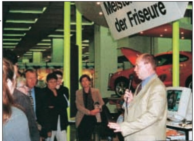
Fulltrúi Handwerkskammer NRW býður gesti velkomna á handverkssýninguna

Um 50 fulltrúar 8 iðngreina frá 9 löndum komu að þessu sinni á fundinn í Köln. Unnið var út frá sameiginlegum gátlista þar sem m.a. var beðið um samanburð á skólum og menntun í einstökum greinum. Fulltrúarnir báru saman inntak og stundafjölda í skóla