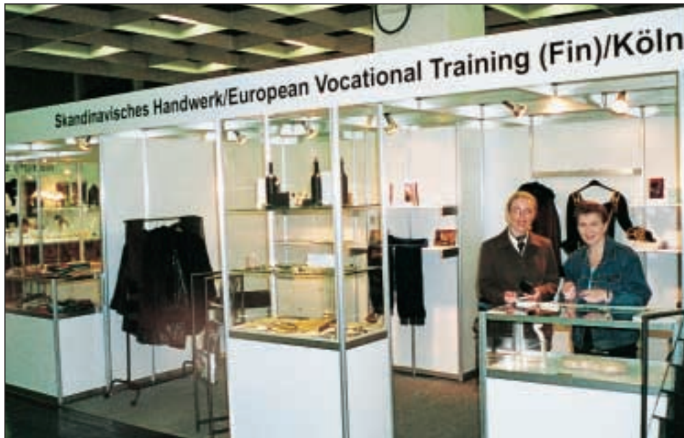
Frá norræna sýningarbásnum