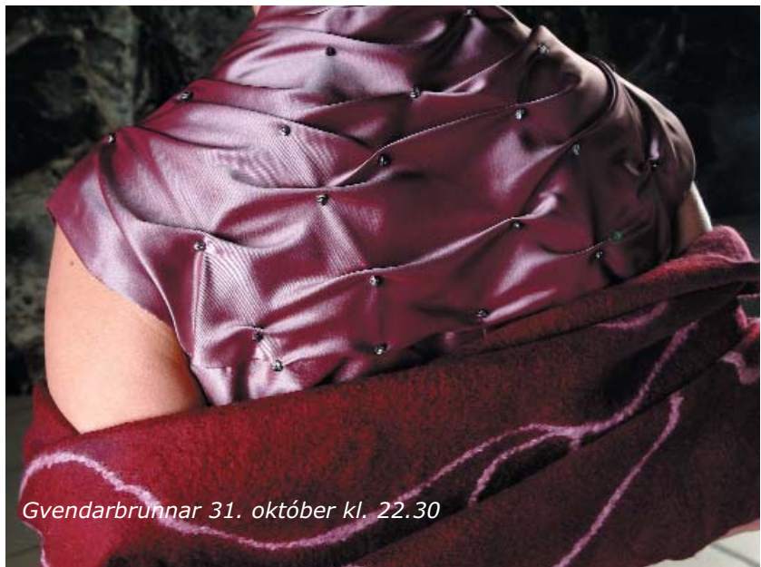
Gvendarbrunnar 31. október kl. 22.30