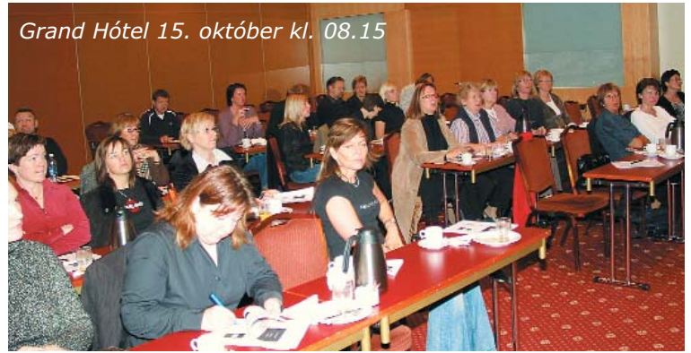
Grand Hótel 15. október kl. 08.15